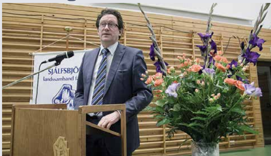
Kristján Þór Júlíusson, heilbrigðisráðherra ávarpaði sýningargesti við upphaf Hjálpartækjasýningarinnar.

Hjálpartækjasýning Þekkingarmiðstöðvar Sjálfsbjargar var haldin dagana 7. – 8. júní í íþróttahúsi fatlaðra að Hátúni 14. Á sýningunni gafst tækifæri til að kynna sér þau hjálpartæki sem í boði eru í dag. Af þeim hjálpartækjum sem voru til sýnis má nefna léttasta hjólastól í heimi, rafmagnshjólastóla, tjáskiptatölvu og sérútbúnað í bíla. Sjúkratryggingar Íslands kynntu rafræna þjónustu sína og Þekkingarmiðstöð Sjálfsbjargar veitti upplýsingar og kynnti miðstöðina. Þá kynntu fyrirtækin Eirberg, Fastus, Stoð, Öryggismiðstöðin og Össur margs konar hjálpartæki og annan búnað sem þau selja og gagnast fötluðum.