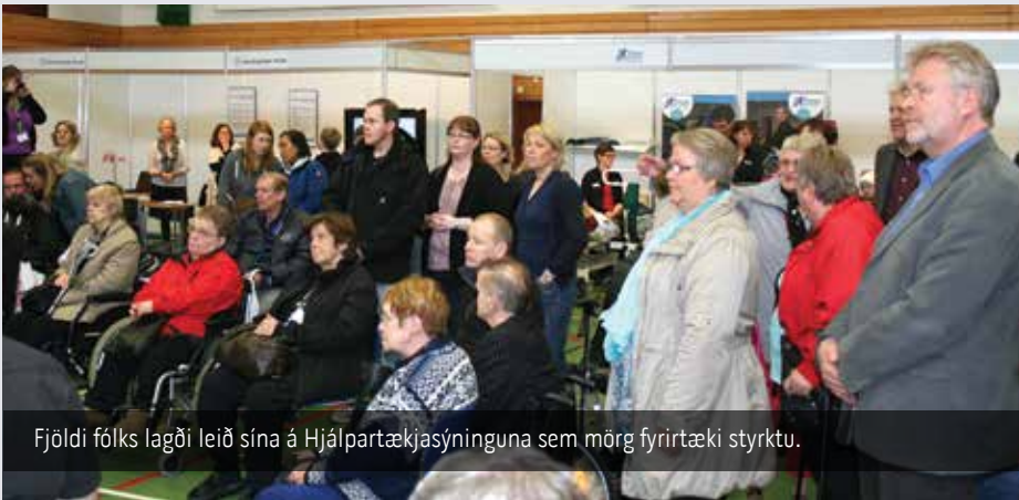
Fjöldi fólks lagði leið sína á Hjálpartækjasýninguna sem mörg fyrirtæki styrktu.

Sýningin var sótt bæði af fötluðum og öðrum og var alatalað hvað vel að verki var staðið. Fjölmenni var báða sýningardagana og var öll aðkoma að sýningargripum og aðstandendum fyrirtækja og stofnana til fyrirmyndar, en hægt var að fá ítarlegar upplýsingar um hvert tæki fyrir sig. Þeir sem sóttu sýninguna voru því meðvitaðri um þær leiðir sem hægt er að fara og hvert á að leita upplýsinga. Sýninguna setti Kristján Þór Júlíusson heilbrigðisráðherra. Öllum gestum var boðið upp á kaffi og veitingar. Ljósmyndarar Klifurs voru á staðnum og tóku meðfylgjandi myndir.