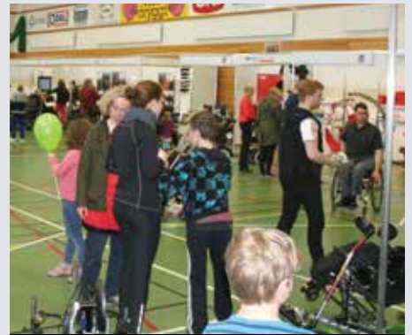
Kynningarbásar voru margir og mikil fjölbreytni í hjálpartækjum sem kynnt voru.