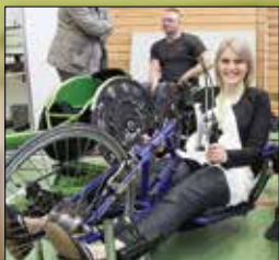
Vel heppnuð Hjálpartækjasýning