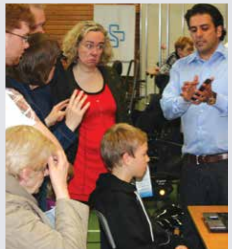
Sölumaður kynnrir fyrir áhugasömum sýningargestum nýja tækni.