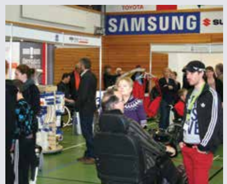
Áhugasamir gestir á Hjálpartækjasýningunni ræddu málin og kynntu sér vörurvalið.